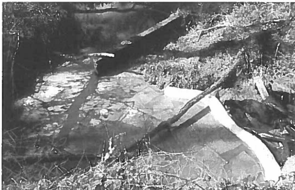
Barrage flottant sur le ruisseau « La Boulade »